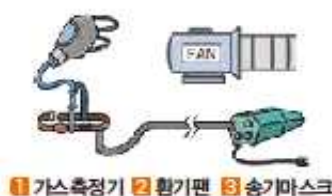
1 가스측정기 2 환기팬 3 송기마스크