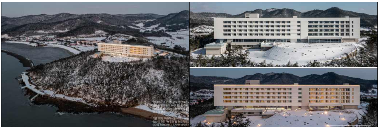
(발주기관) 한국관광공사 / (설계자) 아파랏체·적재건축사사무소 / (시공사) 인동종합건설㈜