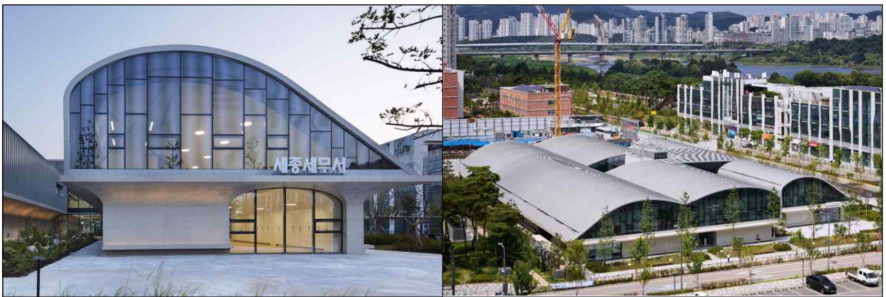
(발주기관) 행복청(수요기관 국세청) / (설계자) (주)매스스터디스 / (시공사) 삼인종합건설(주)

(우수 실무자상 수상자 : 행복청(행정중심복합도시건설청) 윤보섭 사무관)