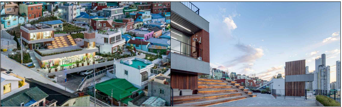
(발주기관) 부산광역시 영도구 / (설계자) ㈜플로건축사사무소 / (시공사) ㈜일성종합건설

□ 인구감소 시대, 잘 비워냄의 미학 : 부산 베리베리굿봉산센터 (우수 총괄·공공건축가상 수상자 : 동의대 신병윤 교수)