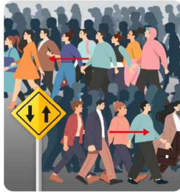
원활한 보행 흐름을 위해 오른쪽으로 통행해요