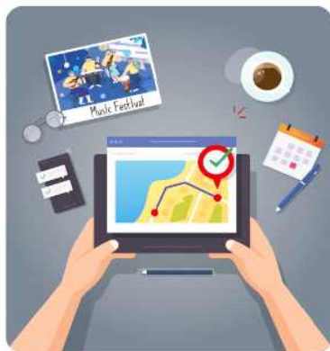
축제장, 공연장 등 방문 장소의 혼잡상황과 주변 이동로를 확인해요