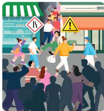
사람이 많이 모인 곳의 좁은 길, 비탈길에서는 사고발생 위험이 높으니, 주의가 필요해요