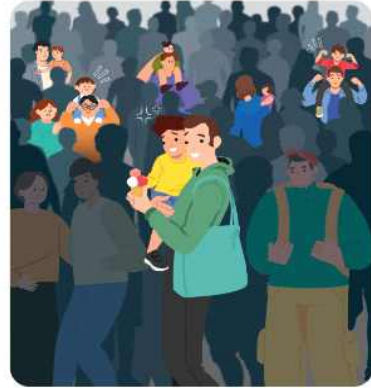
아동을 동반한 경우, 안거나 목마를 태워 보호하세요