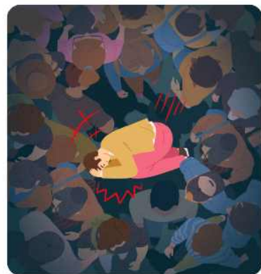
넘어져서 일어날 수 없다면, 머리는 두팔로 감싸고, 다리는 최대한 몸쪽으로 당겨 몸을 공처럼 동그랗게 말아 보호하세요