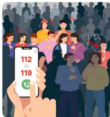
보행속도가 느려지거나, 다른 사람과 신체가 닿으면 즉시 그 자리를 벗어나세요 위험이 느껴지면 신속하게 112 또는 119에 신고해요