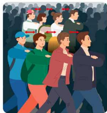
두 손을 가슴 앞으로 모으거나, 한쪽 손으로 반대쪽 팔뚝을 잡아 가슴을 보호하고 심 심 공간을 확보해요