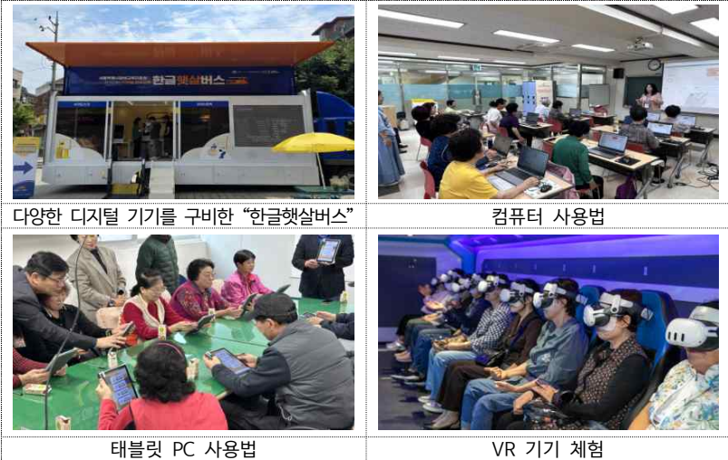
다양한 디지털 기기를 구비한 “한글햇살버스”