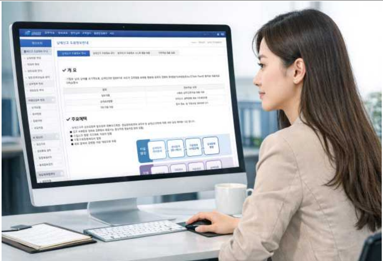
※ 본 사진은 AI로 생성한 이미지입니다.