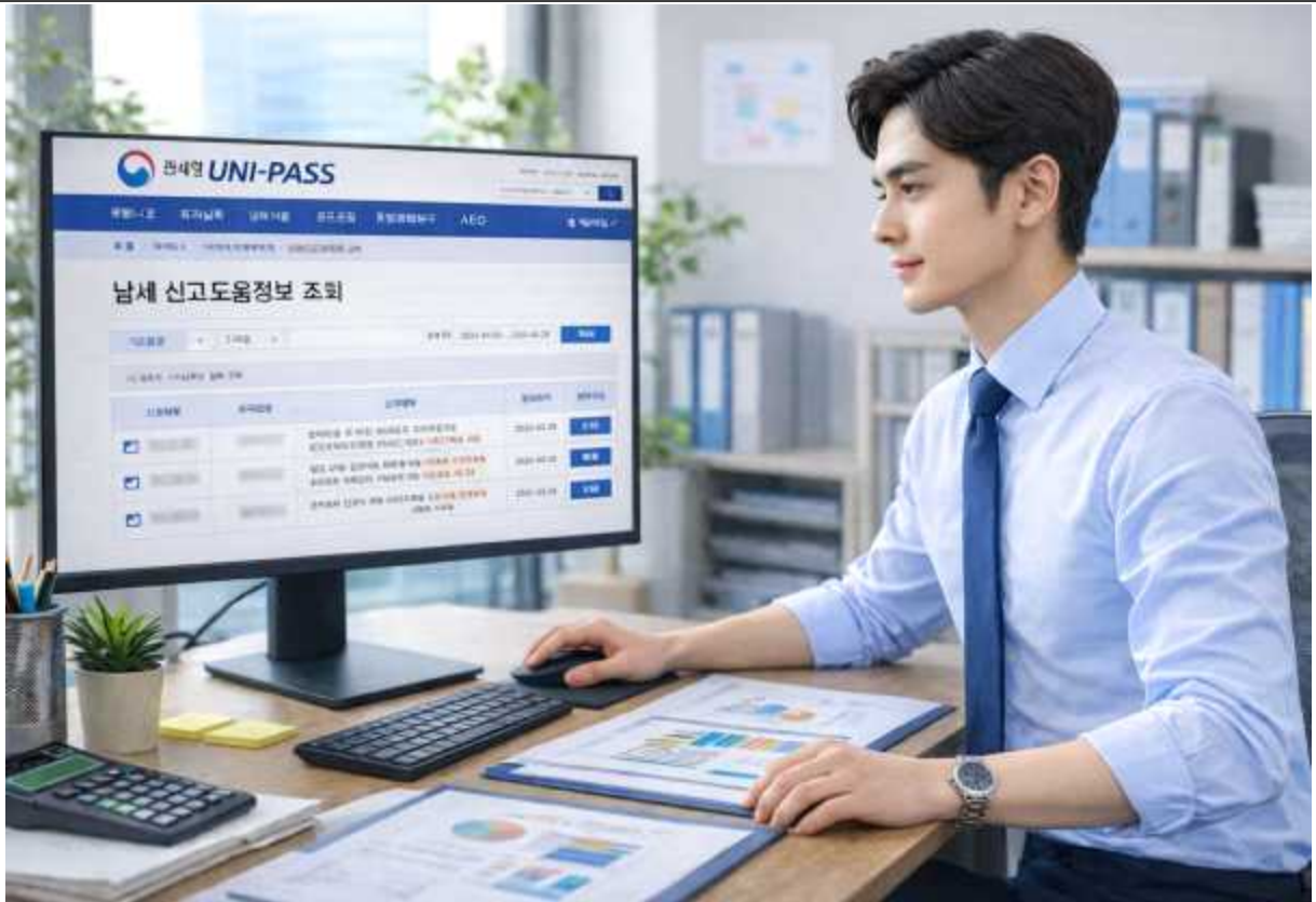
※ 본 사진은 AI로 생성한 이미지입니다.