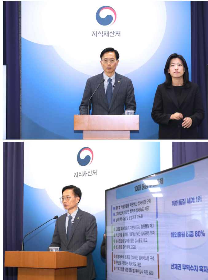
사진 3 : 사전 브리핑 전경사진

사진 1,2 : 김용선 지식재산처장이 3.19.(목) 14시 정부대전청사 기자실(대전 서구)에서 특허심사 서비스 혁신방안 사전 브리핑을 하고 있다.