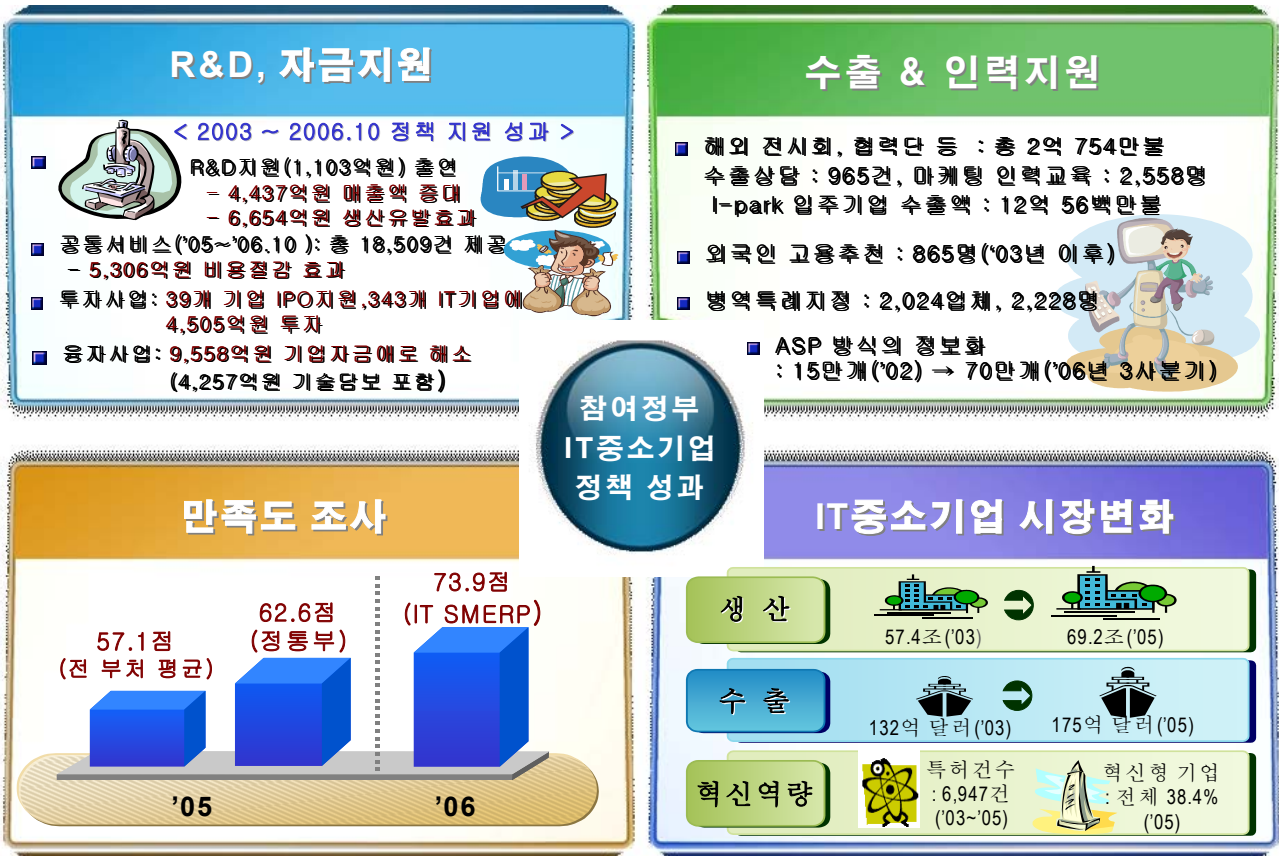
<참여정부 IT 중소기업 정책 성과>

정성적인 측면에서도 IT SMERP 정책의 주요 세부 11개 사업에 대한 종합만족도 조사를 금년 최초 실시하였으며, 그 결과 정책만족도가 73.9점으로 '05년 24개 부처의 만족도 평균 57.1점과 비교 시 높은 수준으로 나타났으며, 정통부는 향후 정책만족도 결과를 정책에 지속적으로 반영하여 정책품질을 강화해나갈 계획이다. (만족도 조사 관련 상세 자료 붙임 2 참고)