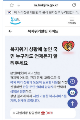
복지로 복지위기알림 메인화면