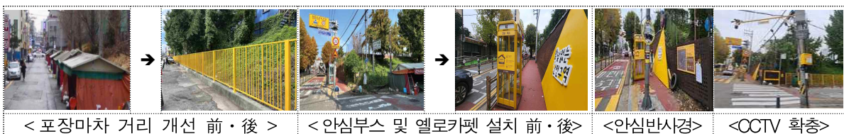
&lt; 포장마차 거리 개선 前 · 後 &gt;