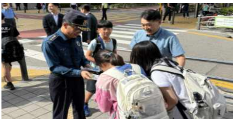
<경찰청장 직무대행 현장점검(9.23.)>