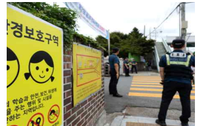
<학교 주변 순찰 강화>