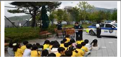
<안전지도 작성 및 매핑 교육>