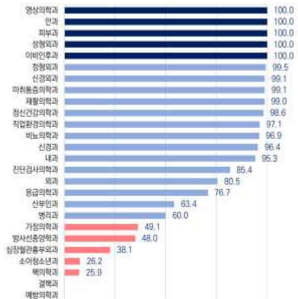
< 2024년 레지던트 1년차 확보율 (%) >