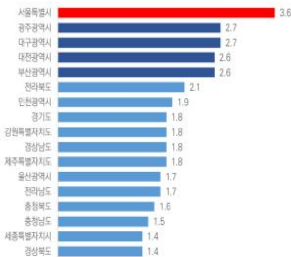
< 시도별 적용인구 천명당 의사 수 (명) >