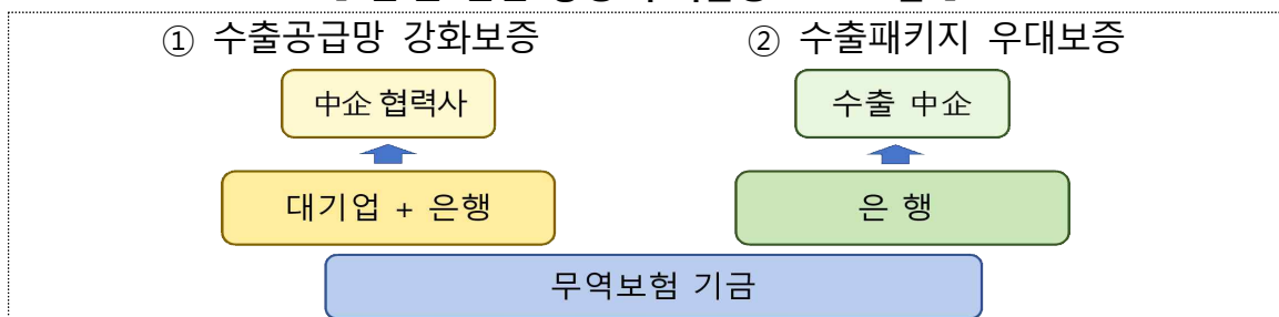
【 민·관 협업 상생 무역금융 프로그램 】