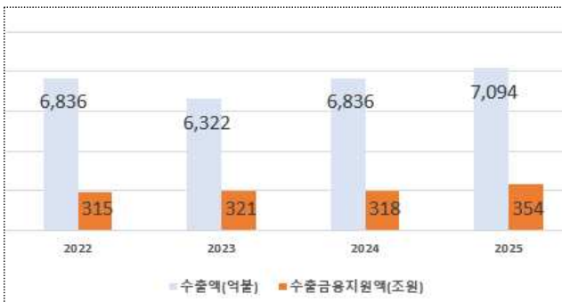
【수출액 및 무역금융 현황】